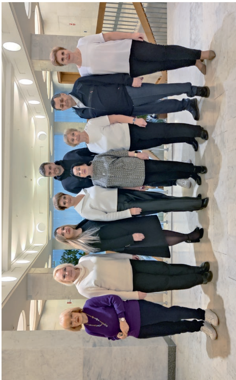
Северо-Западный региональный совет председателей организаций Профсоюза