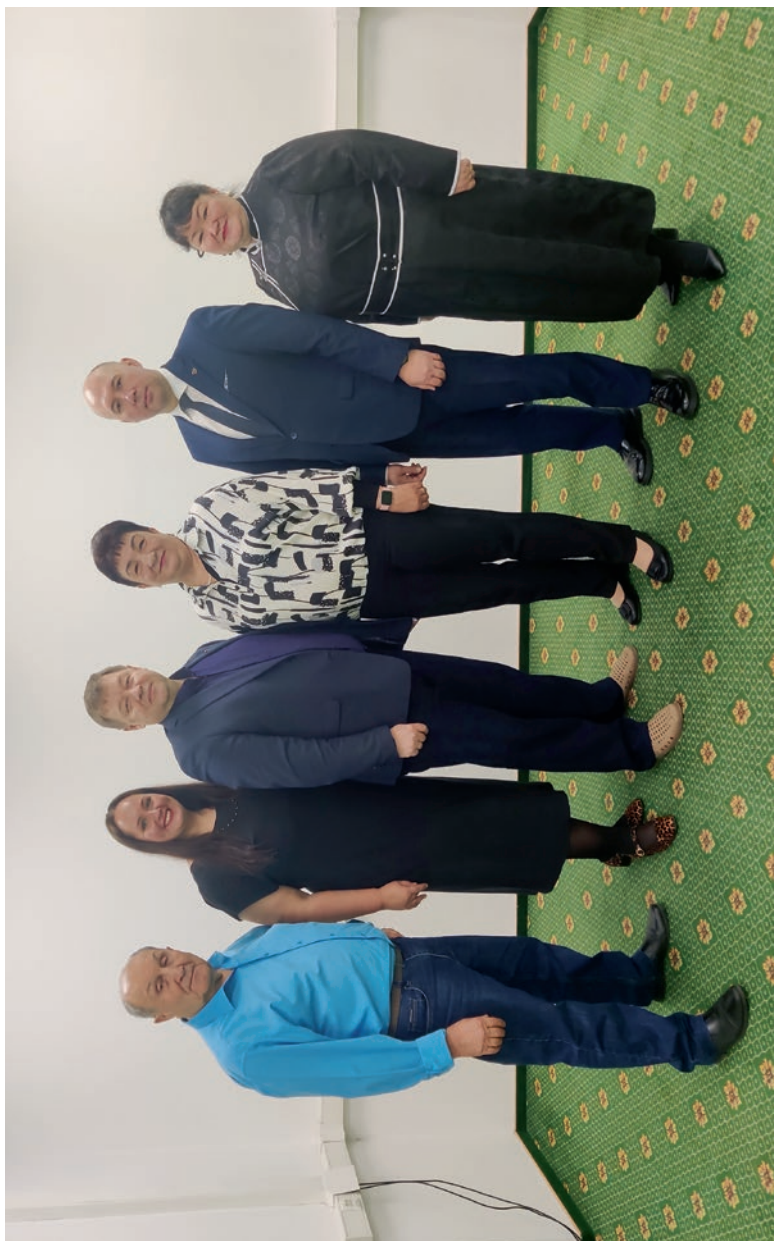
Сибирский региональный совет председателей организаций Профсоюза