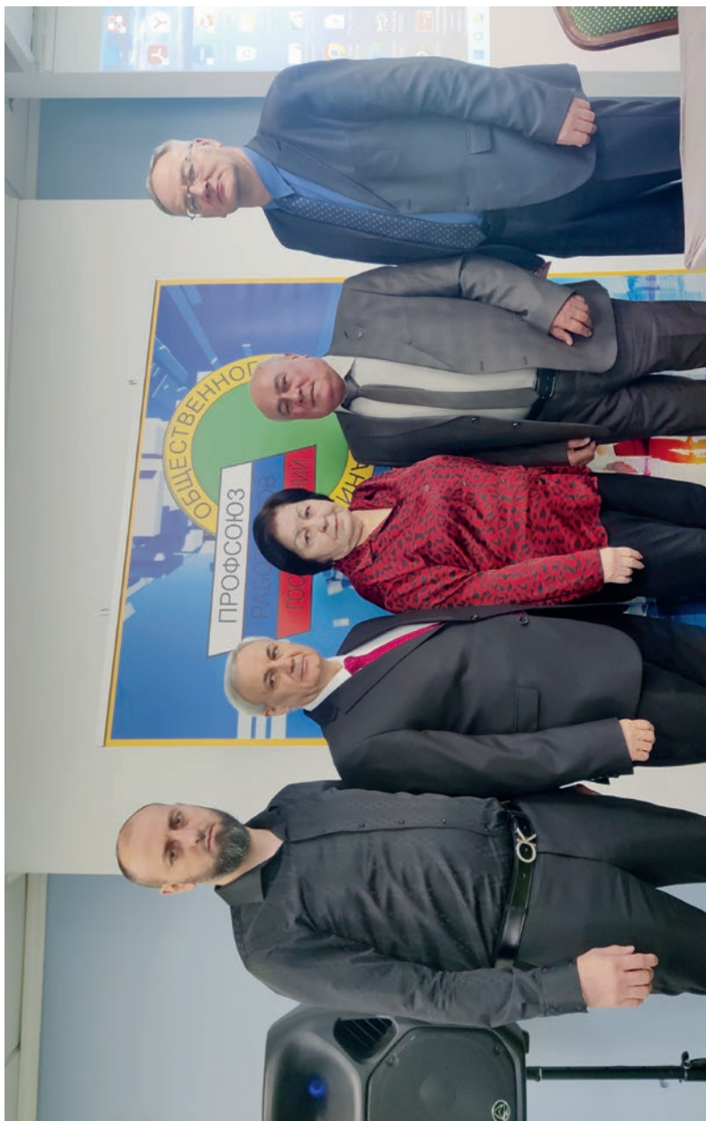
Северо-Кавказский региональный совет председателей организаций Профсоюза