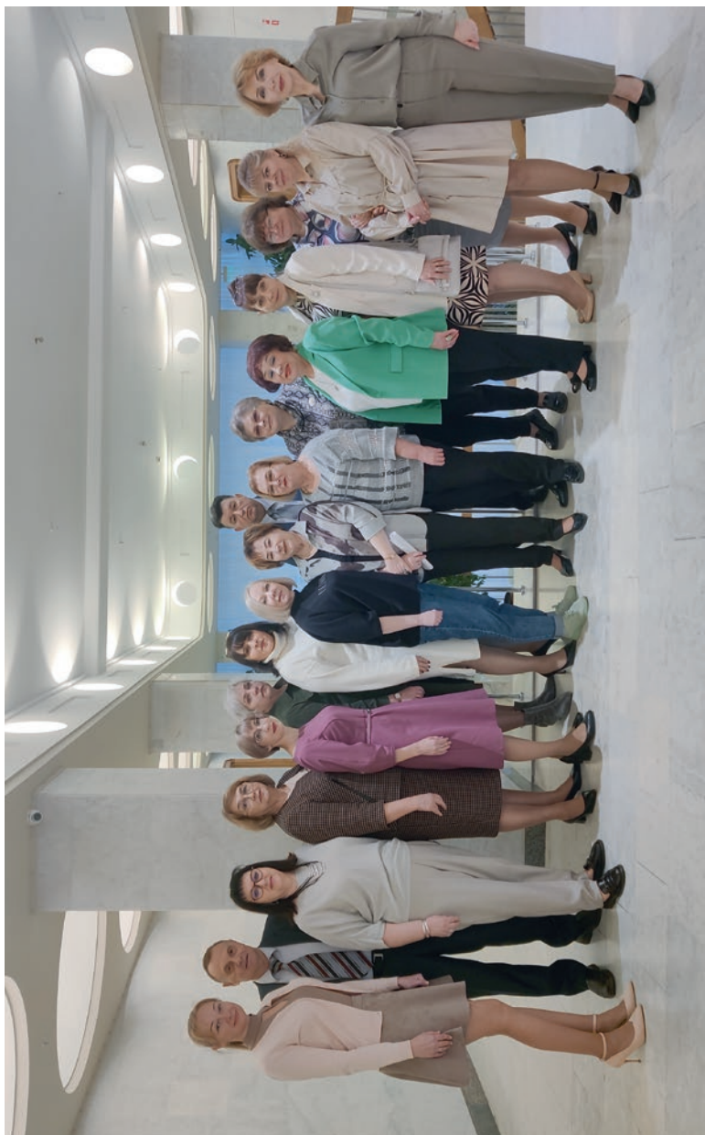
Центральный региональный совет председателей организаций Профсоюза