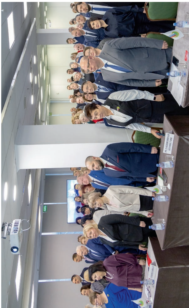
Закрытие XII Съезда Профсоюза