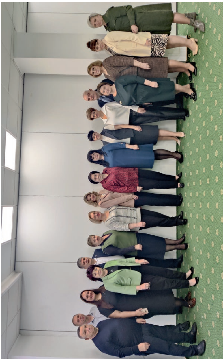
Постоянная комиссия ЦК Профсоюза по социально-экономическим проблемам