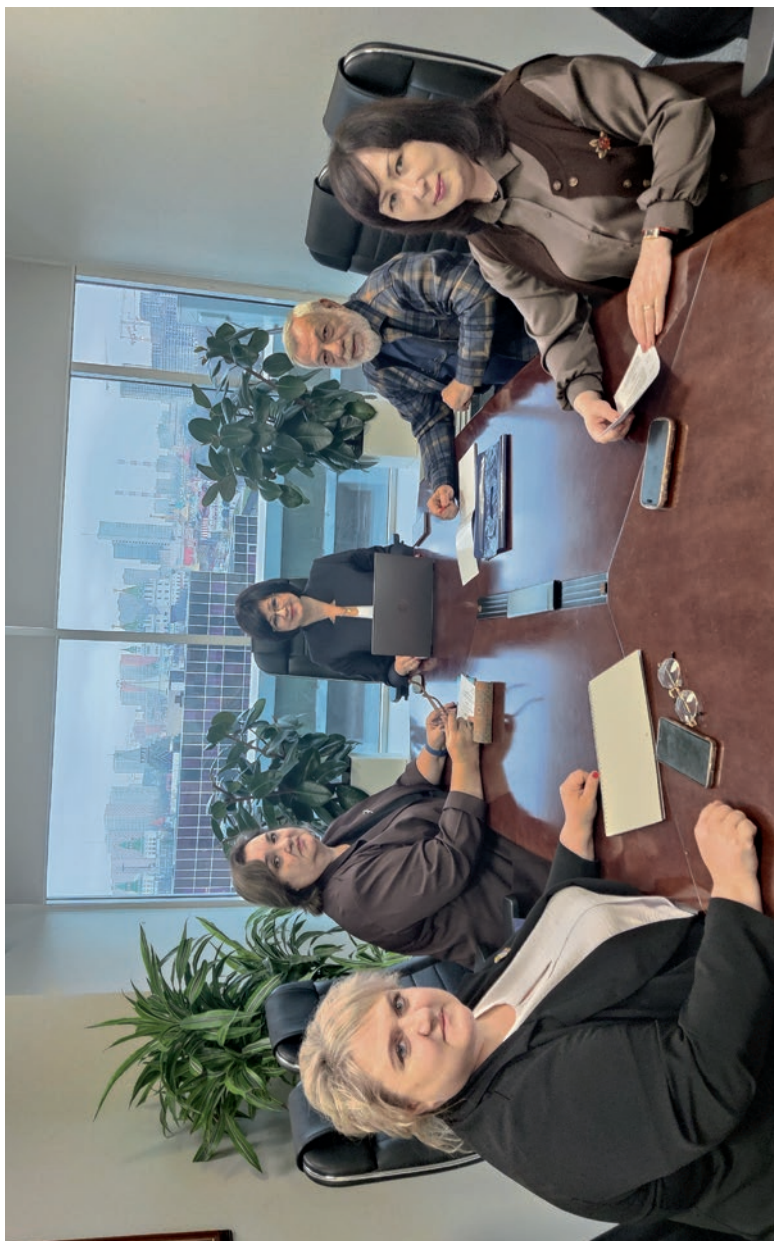
Заседание Контрольно-ревизионной комиссии Профсоюза