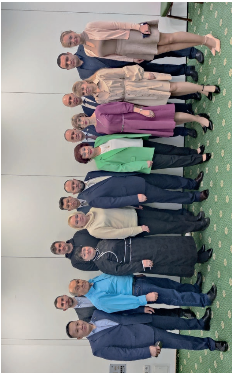
Постоянная комиссия ЦК Профсоюза по правозащитной работе