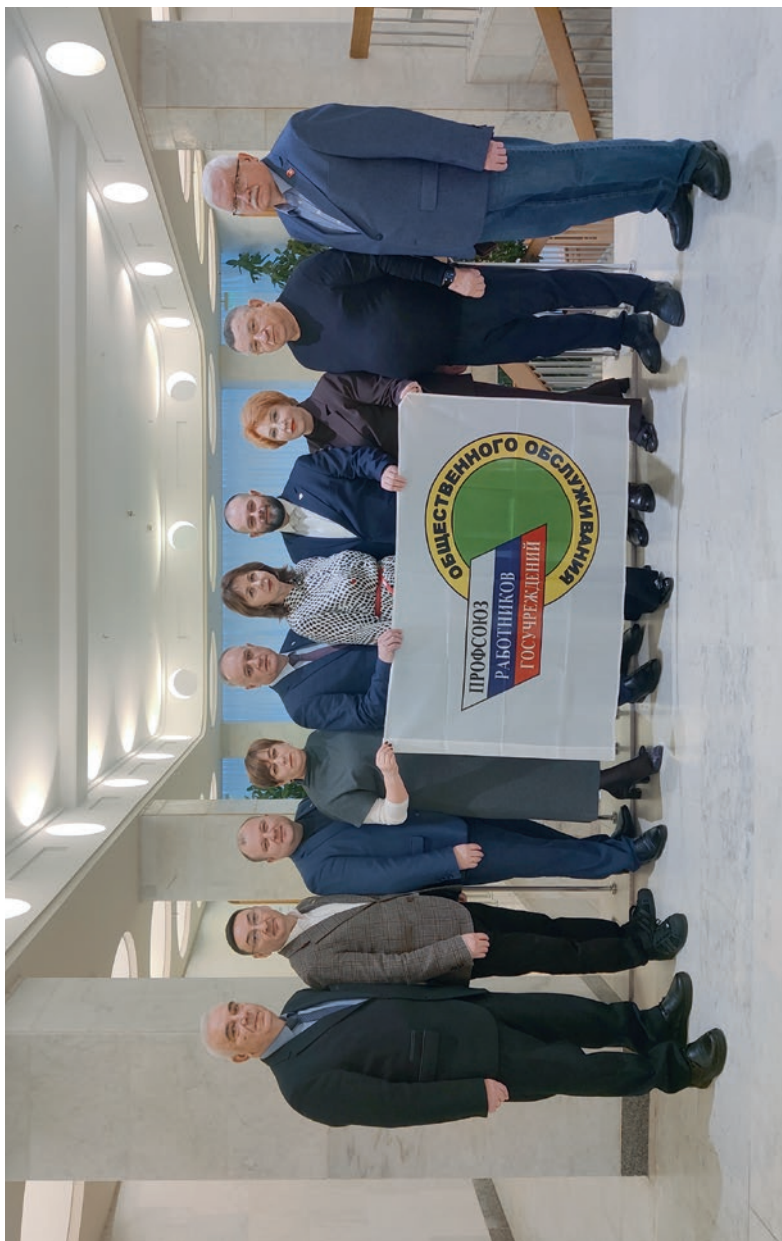
Приволжский региональный совет председателей организаций Профсоюза