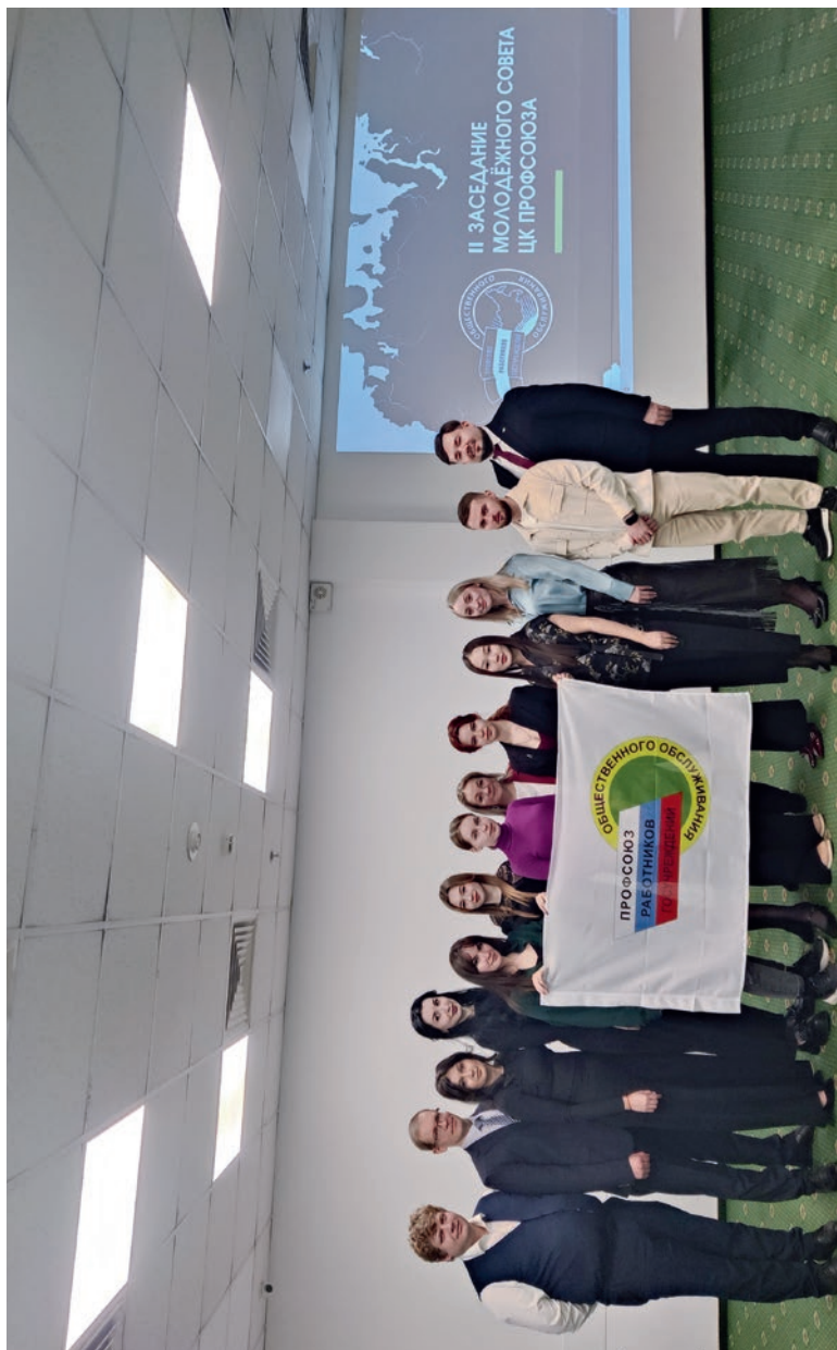
Молодежный совет ЦК Профсоюза