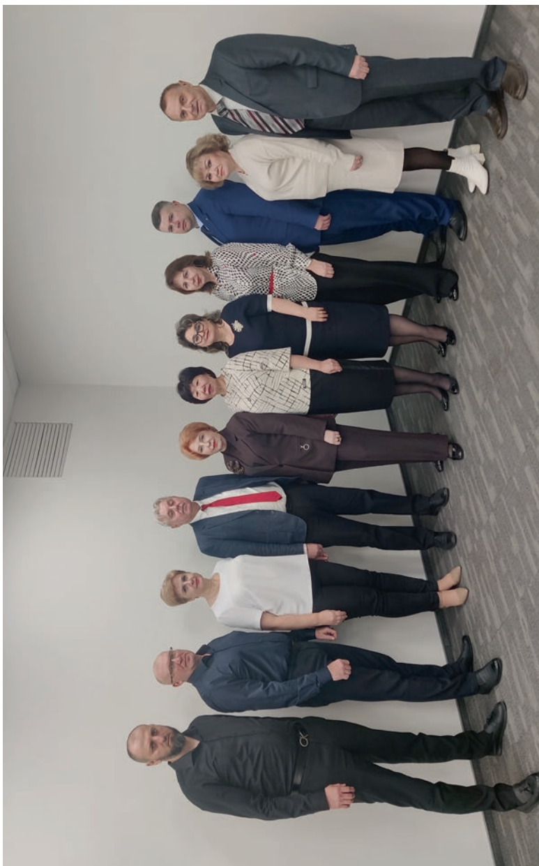
Постоянная комиссия ЦК Профсоюза по охране труда и здоровья