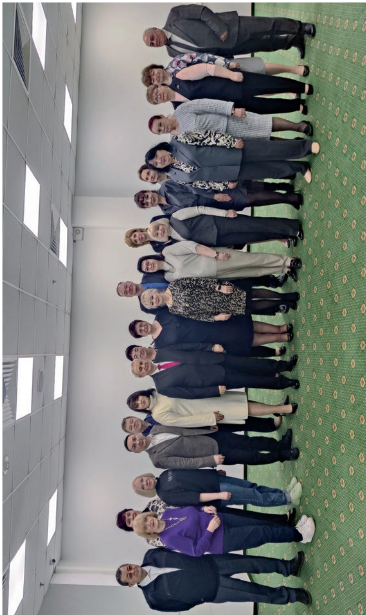
Постоянная комиссия ЦК Профсоюза по организационной работе, кадровой политике и работе с молодежью