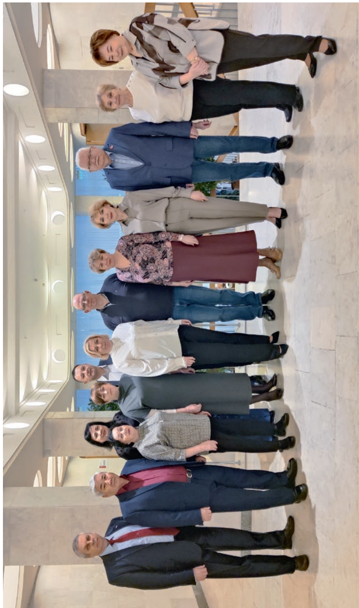
Постоянная комиссия ЦК Профсоюза по реализации финансовой политики Профсоюза