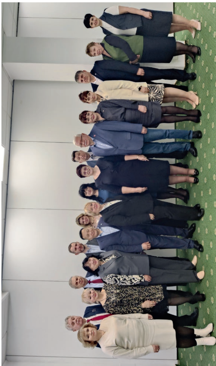
Семинар в рамках стажировки вновь избранных председателей региональных организаций Профсоюза