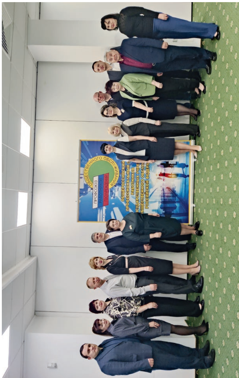
Южный региональный совет председателей организаций Профсоюза