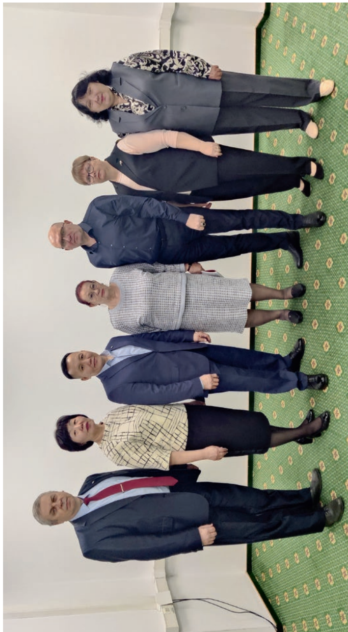
Дальневосточный региональный совет председателей организаций Профсоюза