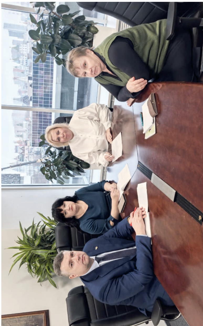
Уральский региональный совет председателей организаций Профсоюза