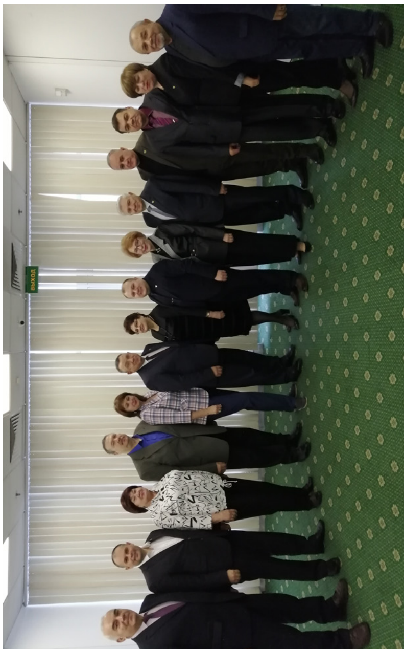
Приволжский региональный Совет председателей организаций Профсоюза