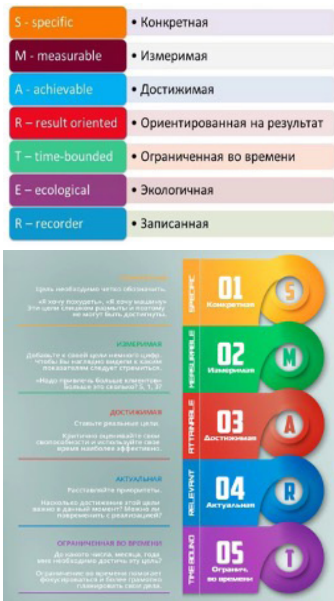
Рис. 2. SMART, SMARTER требования, предъявляемые к целям.