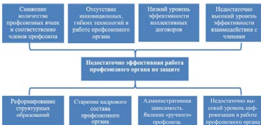
Рис. 1. Пример построения «дерева проблем».

Для правильного определения проблемы и осознания причин происходящего применяется технология построения «дерева проблем» (рис.1). Такой подход позволяет наглядно провести декомпозицию проблем.