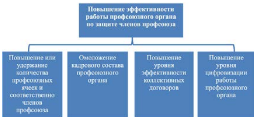
Рис. 3. Пример построения «дерева целей».

Для отображения иерархии целей и их декомпозиции применяется построение «дерева целей» (рис. 3).