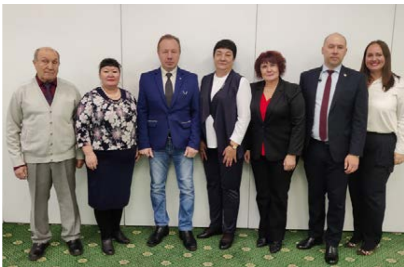
Сибирский региональный Совет председателей организаций Профсоюза