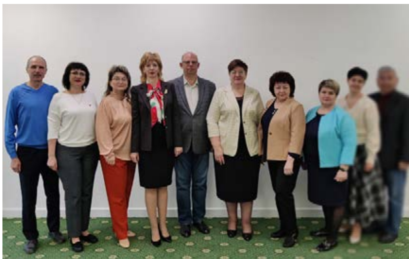
Южный региональный Совет председателей организаций Профсоюза