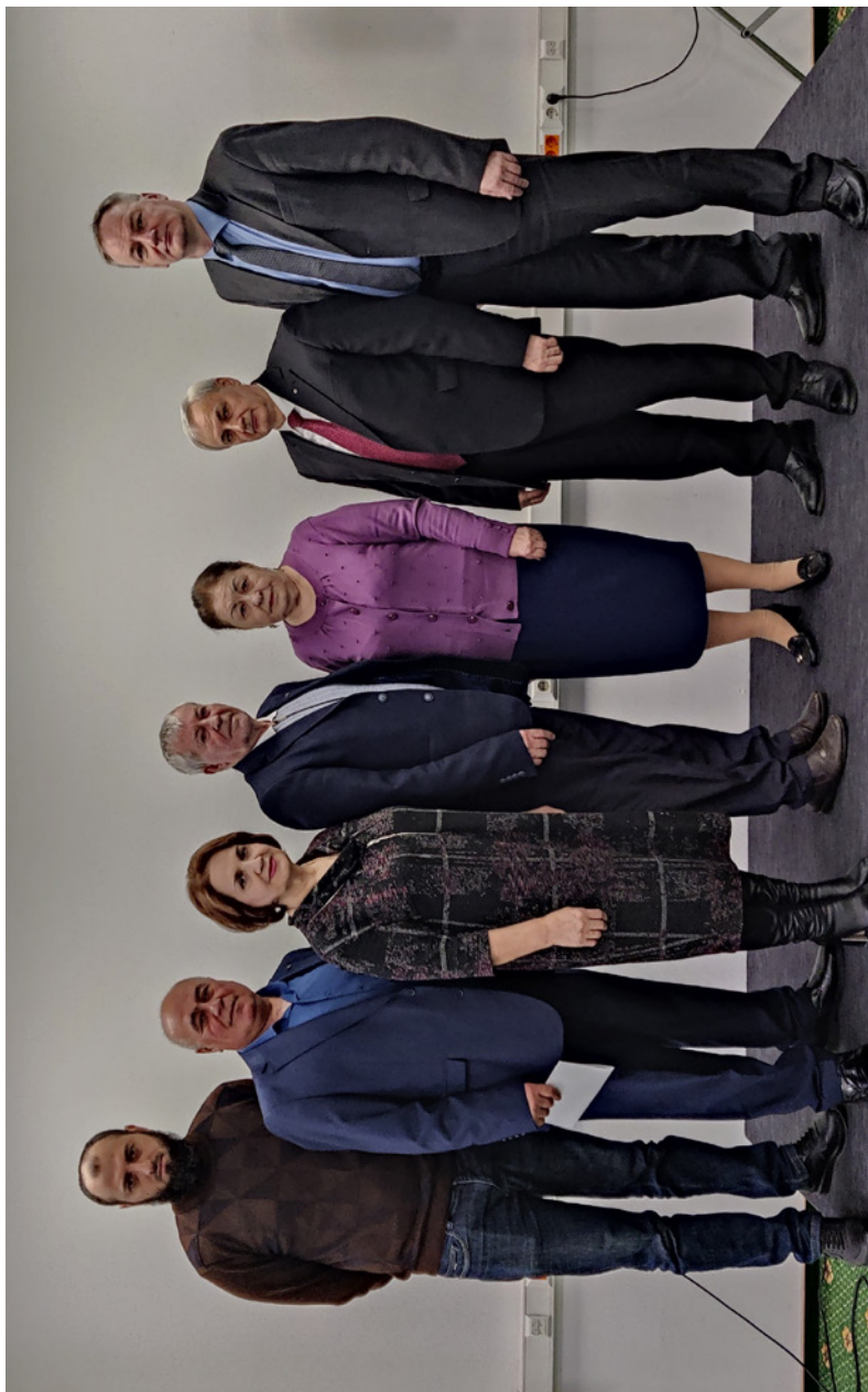
Северо-Кавказский региональный Совет председателей организаций Профсоюза