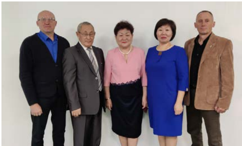
Дальневосточный региональный Совет председателей организаций Профсоюза