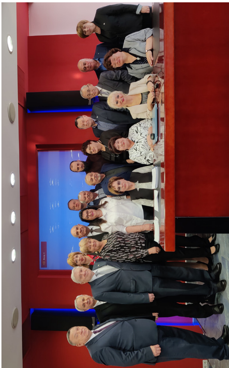
Комиссия ЦК Профсоюза по организационной работе, кадровой политике и работе с молодежью