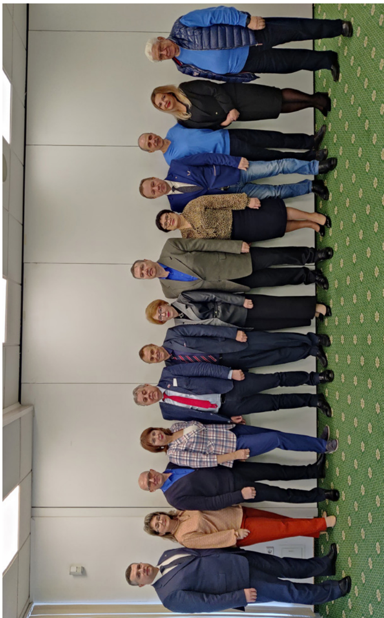
Комиссия ЦК Профсоюза по охране труда и здоровья