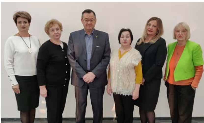
Северо-Западный региональный Совет председателей организаций Профсоюза