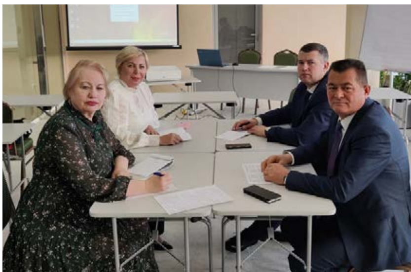
Уральский региональный Совет председателей организаций Профсоюза