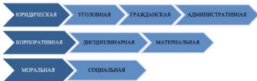
Рис. 7. Виды ответственности ЛПР.

Одним из основных вопросов в процессе принятия управленческих решений является вопрос об ответственности ЛПР (рис.7).