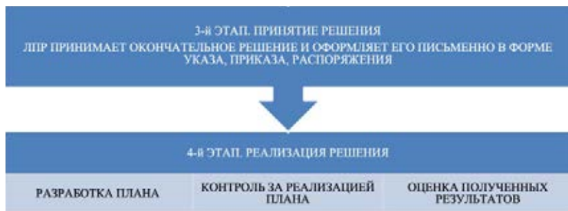
Рис. 4. Процесс принятия управленческого решения.

Он состоит из нескольких логически связанных этапов формирования управленческого решения, каждый из которых включает последовательные звенья.