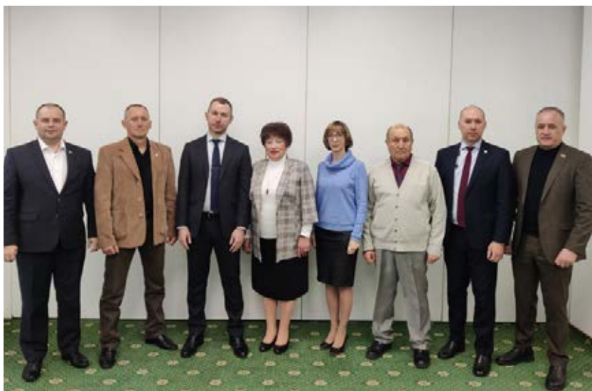
Комиссия ЦК Профсоюза по правозащитной работе