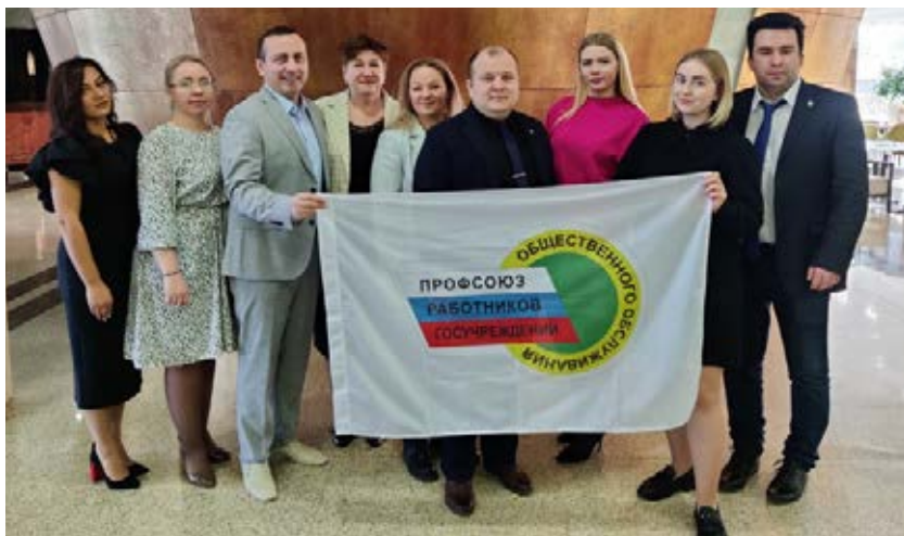
Молодежный совет ЦК Профсоюза