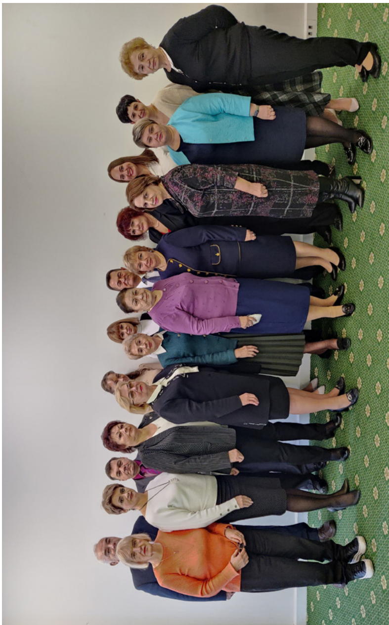
Комиссия ЦК Профсоюза по социально-экономическим проблемам