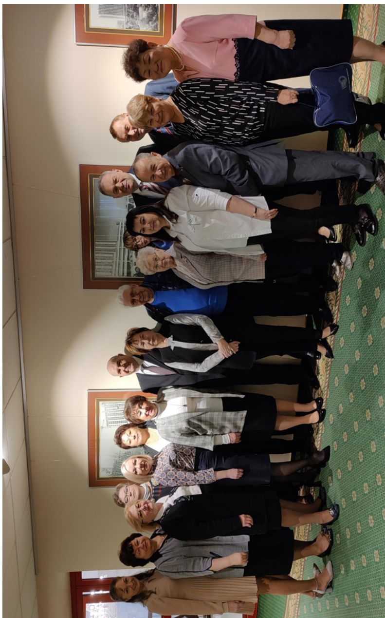
Центральный региональный Совет представителей организаций Профсоюза