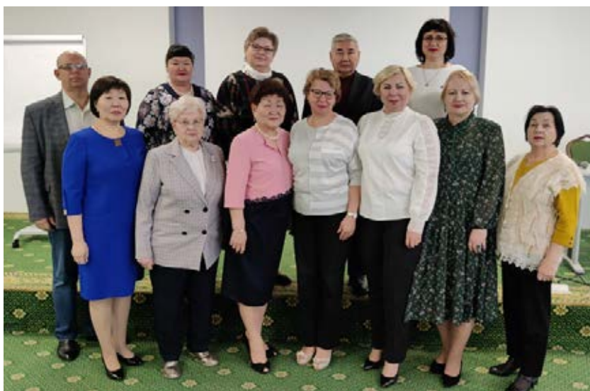
Комиссия ЦК Профсоюза по финансовой политике