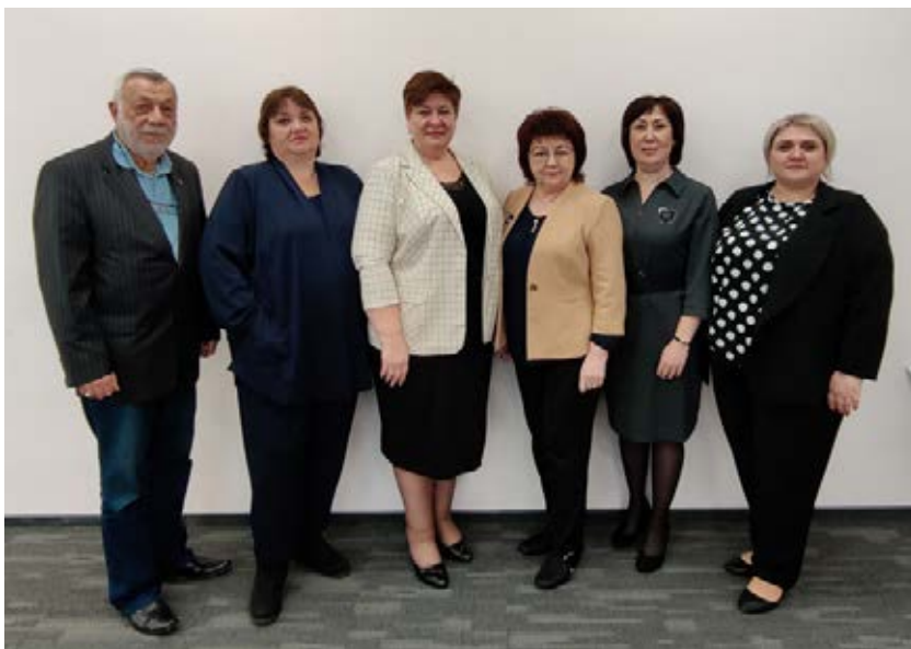
Заседание Центральной ревизионной комиссии Профсоюза