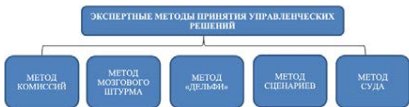
Рис. 5. Методы принятия управленческого решения.

2. Анализ результатов и оценка эффективности управленческого решения. Реализованный план должен быть подвергнут тщательному анализу с целью оценки эффективности принятых управленческих решений. Такой анализ должен быть направлен на выявление слабых и сильных сторон принятых решений, а также на определение дополнительных возможностей, угроз и перспектив. После реализации управленческого решения руководитель должен дать оценку эффективности реализованного решения, которая осуществляется с помощью специальных методов и процедур (рис.5).