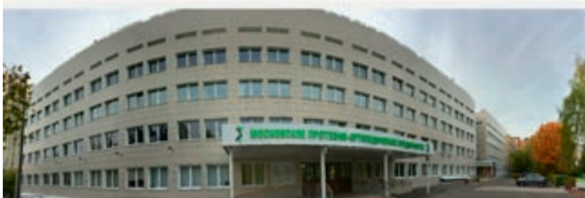
1 июня 2022 год, Москва