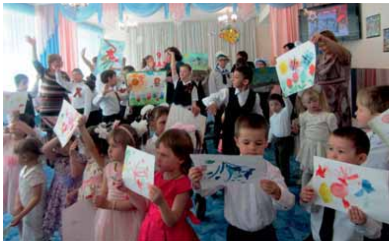
Воспитанники на Празднике неделимости