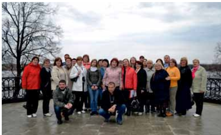
Встреча Белгородских профактивистов с Ярославскими коллегами